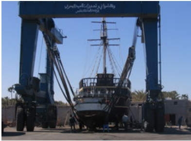
Port protected by a breakwater.